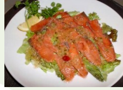
スモークサーモン