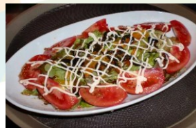
色とりどりサラダ