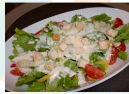
シーザーズサラダ